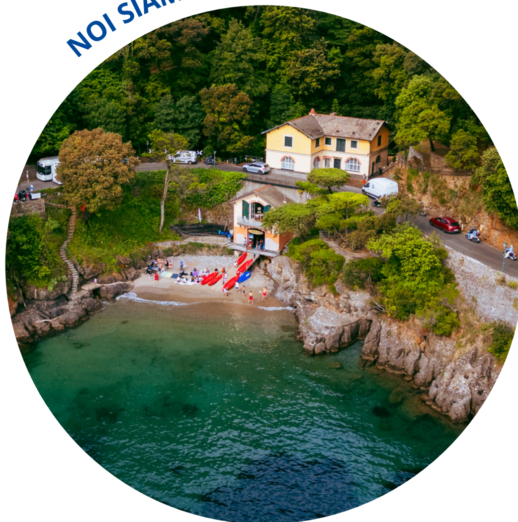
Spiaggia di Niasca, via Duca degli Abruzzi 62, Portofino